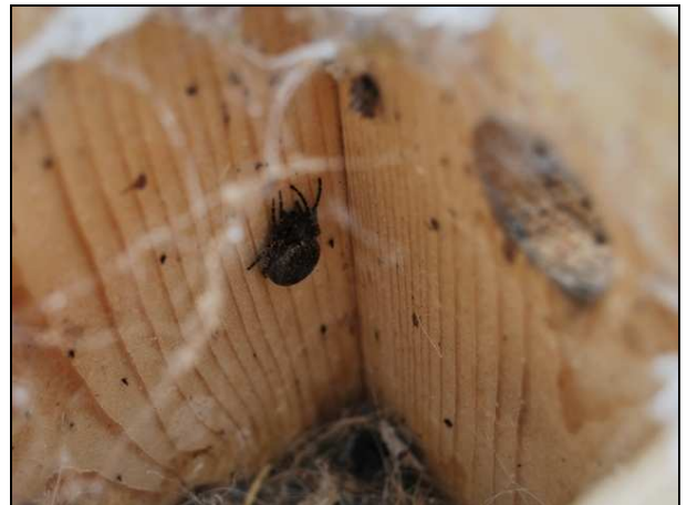
Il n'y a pas que des lérots ou des oiseaux qui peuvent occuper les nichoirs, témoin cette belle épeire nocturne (ou épeire des fissures) (Nuctenea umbratica) (27/03/10 - Walckiers – Schaerbeek)