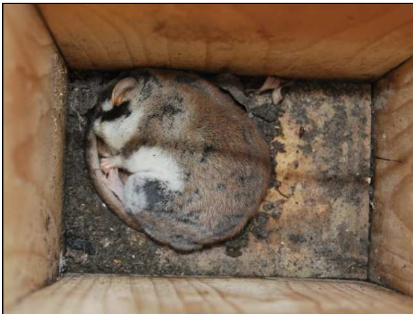
Certains lérots s'étant déjà réveillés de leur hibernation occupent le nichoir comme abri diurne. Dans ce cas, aucun débris végétal ne garnit le nichoir (27/03/10 - Walckiers – Schaerbeek)