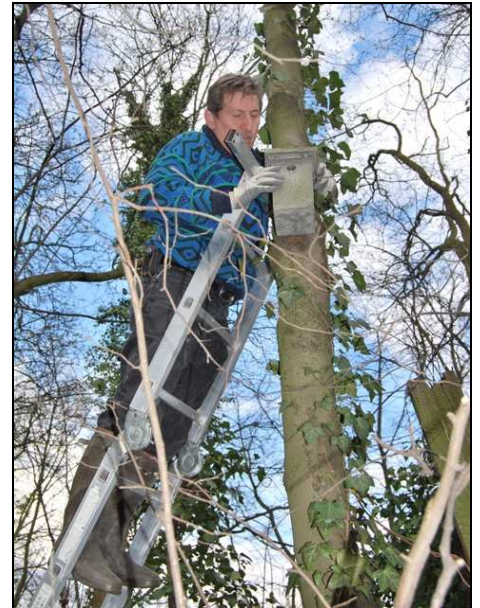
L'approche et l'examen du nichoir nécessitent quelques précautions (27/03/10 - Walckiers – Schaerbeek)